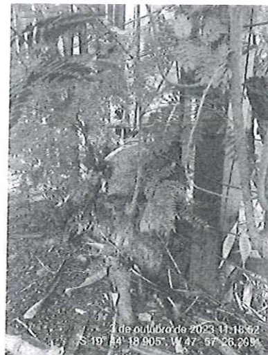
Figura 2 – Espécime para desmonte.