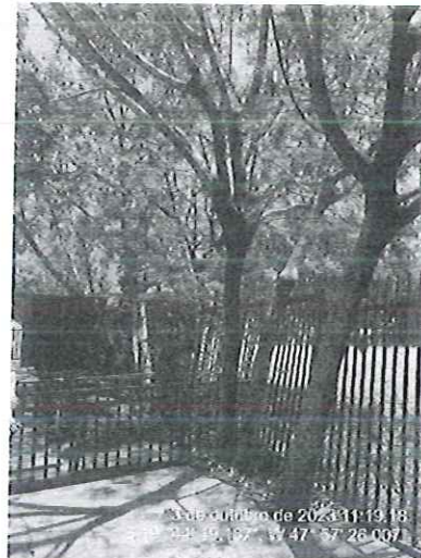
Figura 1 – Leucenas em conflito com a grade.